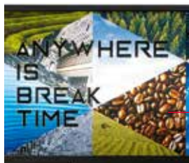
Design moderno e attrattivo