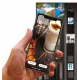
Maestro Touch è compatibile con il sistema di pagamento digitale Breasy