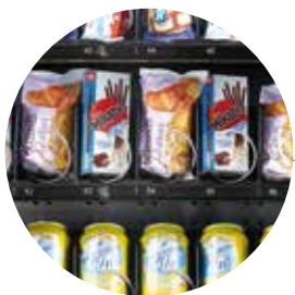
Vetrina ad alta definizione