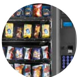
Un distributore elegante e raffinato