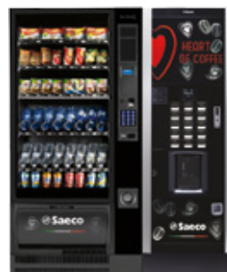
Artico L + Atlante Evo 500