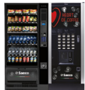
Artico L + Atlante Evo 700