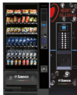
Artico L + Cristallo Evo 600